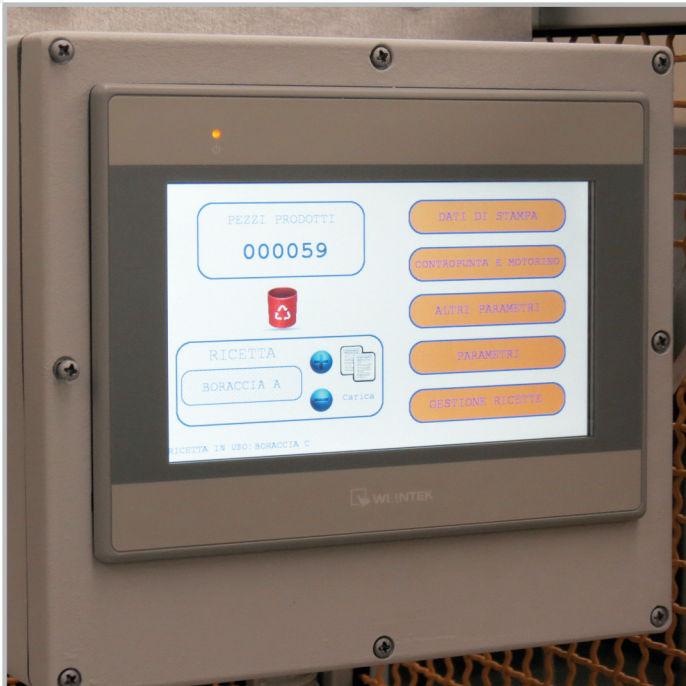
цветной сенсорный дисплей TOUCH SCREEN WITH COLOR DISPLAY

СОПТИЧЕСКОЙ ПРИВОДОЙ OPTICAL REGISTRATION